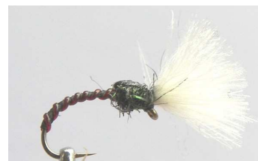
Variante en PPW blanc et cercagle en Vinyl Ribb